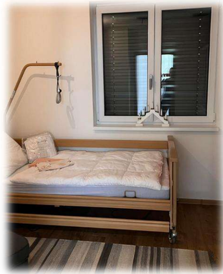
Druhá ložnice první patro 1