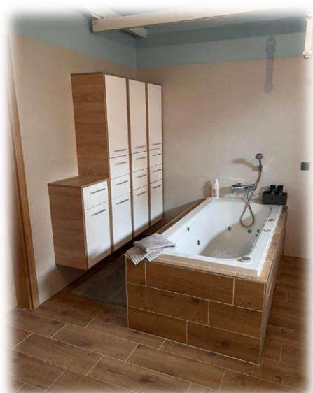
Spodní koupelna se stropním systémem