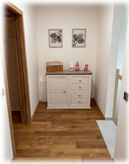
Chodba druhé patro