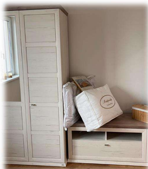
Nábytek ložnice první patro 1