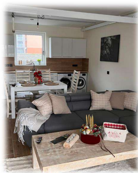
Část obývací části, jídelny a kuchyňský kout